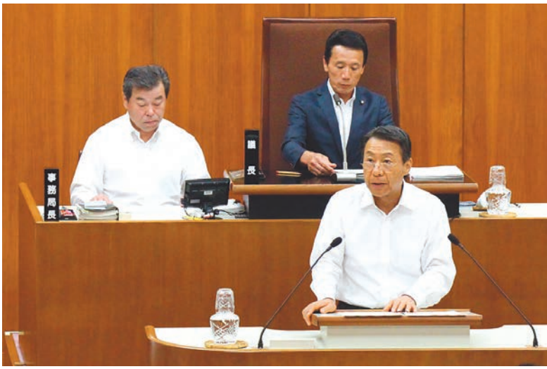
岡村市長が報告と所信を述べる

また、9月2日に全員協議会が開催され「川口市庁舎建設審議会の答申について」を議題とし、各議員からさまざまな意見が述べられました。