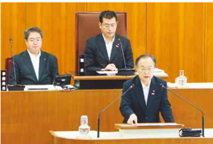
市長の木ノ奥が報告と信所