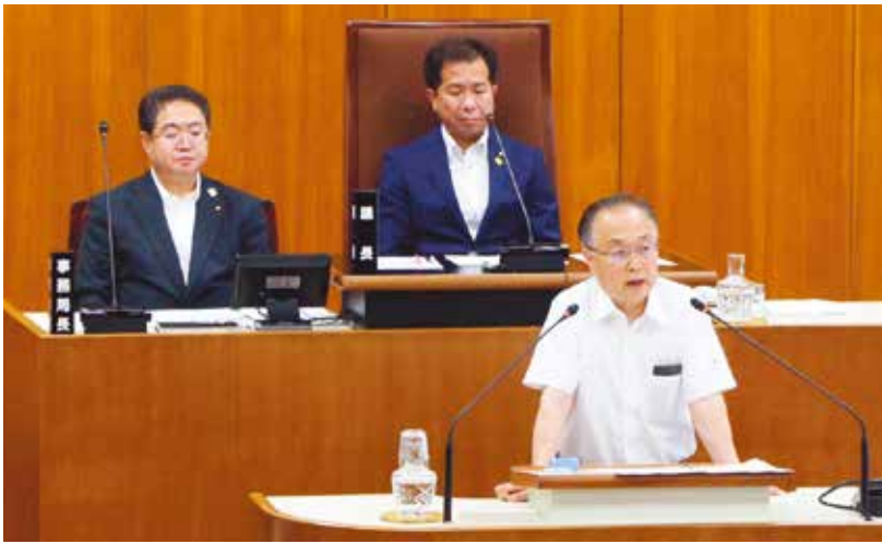
所信と報告を述べる奥ノ木市長