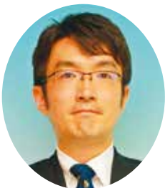
副市長 瀧川 聡史(39歳) 経歴

平成13年総務省に入省 広島市財政局財政課長、 埼玉県企画財政部財政課長などを 経て平成29年6月総務省消防庁 総務課理事官