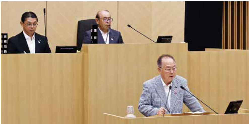
市長ノ木奥の報告と所信