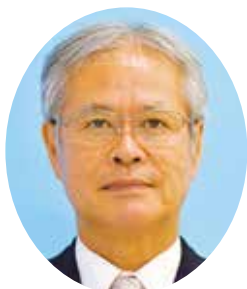
副市長 高田 勝（63歳） 経歴 昭和49年市役所入庁、教育総務部長、総務部長、川口市水道事業管理者を歴任